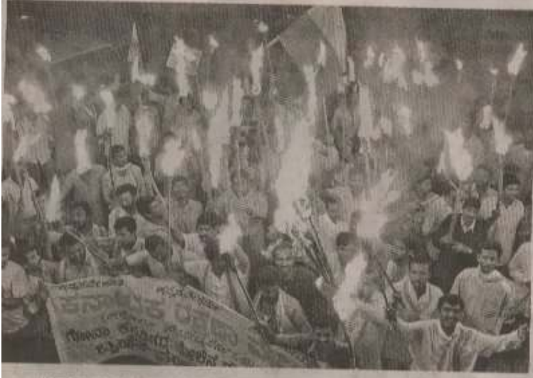
Members of the Kannada Rakshana Vedike taking out a torchlight procession against the Goa Government's action on Kannadigas, in Bangalore on Wednesday.

ಗೋವಾ ಕನ್ನಡಿಗರ ಮೇಲೆ ದಬ್ಬಾಳಿಕೆ: ನಮ್ಮ ಹೋರಾಟ