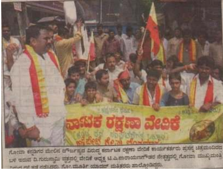
ಗೋವಾ ಕನ್ನಡಿಗರ ಮೇಲಿನ ರೌಪ್ಯವ್ಯವಹಾರದ ವಿರುದ್ಧ ಕರ್ನಾಟಕ ರಕ್ಷಣಾ ವೇದಿಕೆ ಕಾರ್ಯಕರ್ತರು ಪ್ರಶಸ್ತಿ ಚಿತ್ರಮಂದಿರದ ಬಳಿ ಇರುವ ದಿ.ಗುರುಸ್ವಾಮಿ ದತ್ತವರಲ್ಲಿ ವೇದಿಕೆ ಅಧ್ಯಕ್ಷ ಟಿ.ಎ.ನಾರಾಯಣಗೌಡರ ನೇತೃತ್ವದಲ್ಲಿ ಗೋವಾ ಮುಖ್ಯಮಂತ್ರಿ ಕುಮಾರ್ ಸಚಿವರು ಗೋ.ಮೂರ್ತಿ ಯಾದವ್ ಮತಿಕರರು ಪಾಲ್ಗೊಂಡಿದ್ದರು.

ಗೋವಾ ಸರ್ಕಾರದ ಕ್ರಮಕ್ಕೆ ತೀವ್ರ ಖಂಡನೆ ಬೆಂಗಳೂರು : 40 ವರ್ಷಗಳಿಂದ ನಿರಂತರವಾಗಿ ಗೋವಾದ ವ್ಯವಸ್ಥಾ ಬೀಜ್ ನೆಲೆಸಿಟ್ಟು ಸಾಮಾನ್ಯರು ಕನ್ನಡಿಗರ ಕುಟುಂಬಗಳನ್ನು ನೆಲಸಮಗೊಳಿಸಿದ ಗೋವಾ ಸರ್ಕಾರದ ಕ್ರಮವನ್ನು ಕರ್ನಾಟಕ ರಕ್ಷಣಾ ವೇದಿಕೆ ಖಂಡಿಸಿದೆ. ಈ ಕನ್ನಡಿಗರ ಪರಿಶ್ರಮದಿಂದ ಇಂದು ಗೋವಾ ಅರ್ಥಿಕವಾಗಿ ಸದೃಢಗೊಂಡಿದೆ. ಆದರೆ ಅಲ್ಲಿನ ಸರ್ಕಾರ ವೇತ್ಯಾವ್ಯಕ್ತಿಯಲ್ಲಿ ತೊಡಗಿರುವ 250 ಕುಟುಂಬಗಳನ್ನು ಎತ್ತರ ಮಾಡುವುದಾಗಿ ಹೇಳಿ ಈ ದಂಧೆಯಿಂದ ದೂರ ಉಳಿದಿರುವ ಕುಟುಂಬಗಳಿಗೆ ದೀನಿವಾಣಾಗುವಂತೆ ಮಾಡಿದೆ. ಅವರಿಗೆ ಯಾವುದೇ ರೀತಿಯ ಪುನರ್ವಸತಿ ಕಲ್ಪಿಸದಿರುವುದು ಮಿಂಚಾಟವು ಎಂದು ವೇದಿಕೆಯ ರಾಜ್ಯಾಧ್ಯಕ್ಷ ಟಿ.ಎ.ನಾರಾಯಣಗೌಡ ವ್ಯಕ್ತವಾಗಿ ಹೇಳಿಕೆಯಲ್ಲಿ ತಿಳಿಸಿದ್ದಾರೆ.