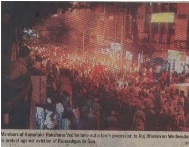
Members of Karnataka Rakshana Vedike take out a torch procession to Raj Bhavan on Wednesday in protest against eviction of Kannadigas in Goa.

This led to heated arguments between the vedike members and the police and caused traffic congestion and tension in the Gandhinagar area. Seeing trouble, police officers permitted the members to march up to the Old Central Jail on Sheshadri Road.